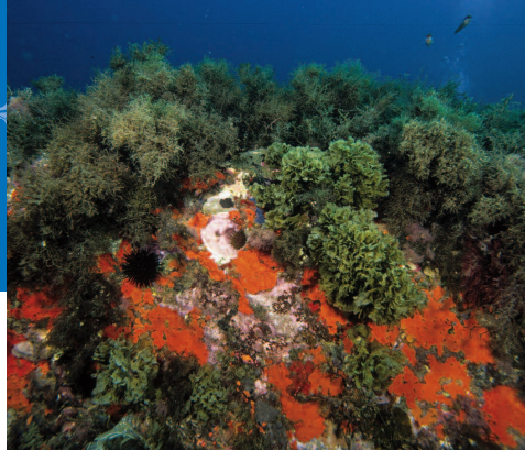
Comunidad de coralígeno