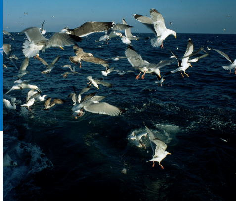
Delta del Ebro