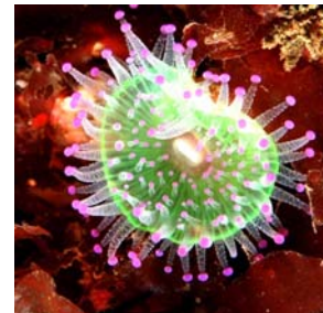
Anémona joya ( Corynactis viridis ). Cabo Peñas, Asturias